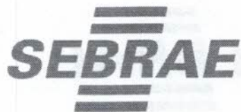
TABELA DE CLASSIFICAÇÃO DAS PROPOSTAS - PREGÃO PRESENCIAL N.º 002/2018